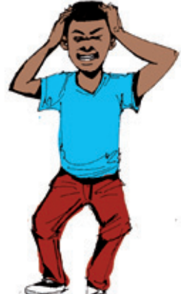
3. Maux de tête